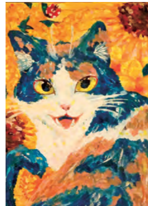
そうしんジュニア賞 「暖かな君」(洋画) 上入佐 茜梨